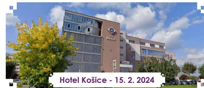
Hotel Košice - 15. 2. 2024