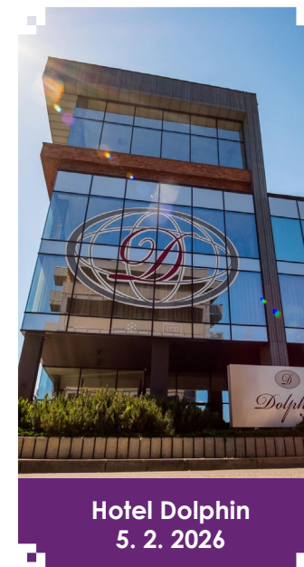
Hotel Dolphin 5. 2. 2026